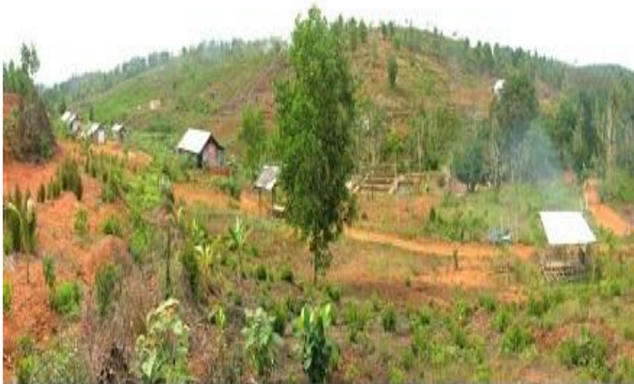
Gambar 4. Foto permukiman penduduk di hutan lindung Sungai Pulai

Hutan lindung yang sudah mulai rusak adalah Hutan Lindung Sungai Pulai, Hutan Lindung Bukit Lengkuas, Hutan Lindung Gunung Kijang dan Hutan Lindung Sei Jago. Hutan Lindung Sungai Pulai memiliki permasalahan berupa pemanfaatan lahan untuk perkebunan sawit, kebun karet rakyat, permukiman dalam kawasan yaitu Kampung Suka Damai, Tirto Mulyo, Pondok Pesantren, dan akses jalan yang tinggi.