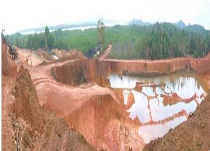
Gambar 5. Foto pemanfaatan kawasan mangrove sebagai tempat pengolahan bauksit dan penampungan limbah tailing

Konsep pengelolaan hutan mangrove adalah menyeimbangkan fungsi fisik, biologik dan ekonomi. Pemanfaatan kayu dari hutan mangrove perlu diimbangi dengan upaya revegetasi/reboisasi agar populasi tanaman mangrove tetap terjaga. Pada daerah-daerah aliran sungai dan tepi laut sebaiknya tanaman mangrove tetap dibiarkan hidup untuk menjaga stabilitas fisik lingkungan dari erosi dan abrasi. Kegiatan reklamasi terhadap area bekas tambang juga harus dilakukan. Usaha ini bisa dilakukan dengan adanya pembuatan lokasi persemaian oleh perusahaan-perusahaan tambang bauksit.