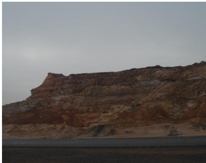
Gambar 2. Lahan bekas tambang bauksit di Kota Tanjungpinang

Hasil perhitungan dan analisis data-data daya dukung fungsi lindung di Kota Tanjungpinang memperlihatkan nilai 0,2901 (Tabel 4). Nilai ini sudah mendekati angka nol, sehingga Kota Tanjungpinang dalam kondisi rusak. Ini artinya kondisi wilayah sudah tidak bisa menjaga kelestarian lingkungan hidup yang mencakup sumberdaya alam dan buatan. Kerusakan lingkungan di Kota Tanjungpinang bisa dipahami karena perkembangan kota yang pesat dengan maraknya permukiman dan perkantoran serta bekas kawasan tambang bauksit yang belum direklamasi. Lahan-lahan bekas tambang bauksit dibiarkan begitu saja sehingga muncul lahan terbuka yang tidak teratur dan kurang terawat.