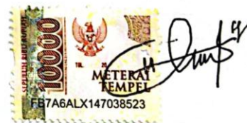
Nabila Shafa Aflaha