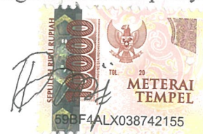
Thifal Difla Zanwa