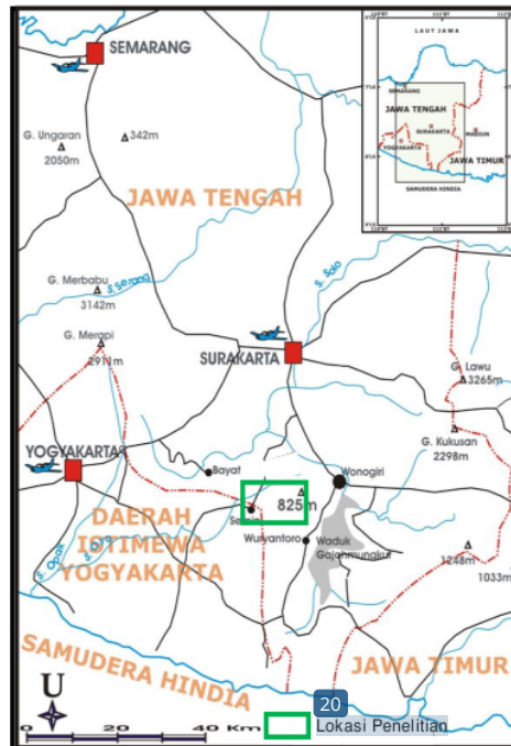
Gambar 1. Peta lokasi daerah penelitian yang berada di wilayah Desa Pagutan dan sekitarnya, Kecamatan Manyaran, Kabupaten Wonogiri, Jawa Tengah