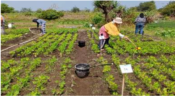
Gambar 4.8 Pemupukan Susulan

Pemupukan susulan dilakukan pada umur 2 dan 4 minggu setelah tanam dengan menggunakan pupuk NPK 200 kg/ha atau 0,12 kg/ petak. Pupuk dilarutkan dengan 10 l air per petaknya, kemudian dikocor dan disiramkan pada parit diantara tanaman. Pemupukan susulan dapat dilihat pada Gambar 4.8.