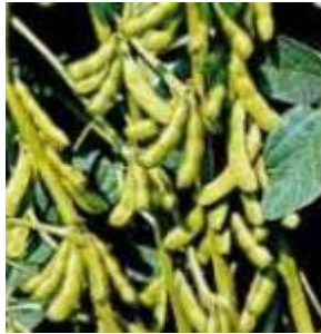
Gambar 2. Polong Kedelai (Adisarwanto, 2008)