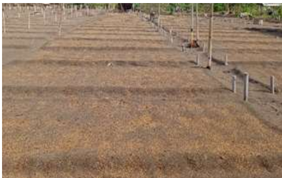
Gambar 4.5. Persiapan Lahan Budidaya Kedelai di Lahan Pasir

pupukdasar dengan dosis 5 kg/petak. Bedeng selanjutnya ditaburi Trichoderma sp. sesuai dengan perlakuan.