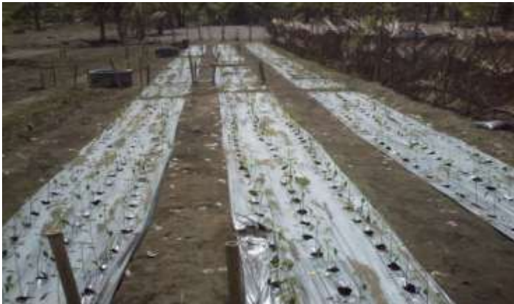
Gambar 4.1. Penggunaan Mulsa di Lahan Pasir

Penggunaan mulsa ini sangat penting dilahan pantai karena dapat menghemat lengas tanah sehingga kebutuhan lengas untuk tanaman terutama pada musim kemarau diharapkan dapat tercukupi. Dari hasil penelitian pemberian mulsa glerecida dan jerami padi sebanyak 20-30 ton dapat meningkatkan hasil pada tanaman jagung di lahan pantai, selain itu pemberian mulsa berupa pangkasan tanaman ternyata juga lebih efektif sebagai mulsa dibandingkan dengan pemerian pupuk hijau (Putri, 2011).