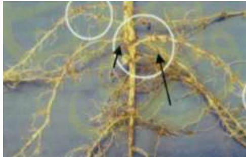
Gambar 2.2 Morfologi Akar dan Bintil Kedelai (Irawan, 2006)

Sistem perakaran kedelai terdiri dari dua macam, yaitu akar tunggang dan akar sekunder (serabut) yang tumbuh dari akar tunggang. Pada cekaman tertentu seperti kadar air tanah yang terlalu tinggi, kedelai akan membentuk akar adventif yang tumbuh dari bawah hipokotil. Perkembangan akar kedelai dipengaruhi oleh kondisi kimia dan fisik tanah, cara pengolahan tanah, jenis tanah, kecukupan unsur hara, serta ketersediaan air di dalam tanah. Pertumbuhan akar tunggang bisa mencapai 2 m atau lebih apabila kondisi optimal (Adisarwanto, 2008). Morfologi Akar dan Bintil Kedelai dapat dilihat pada Gambar 2.2 .