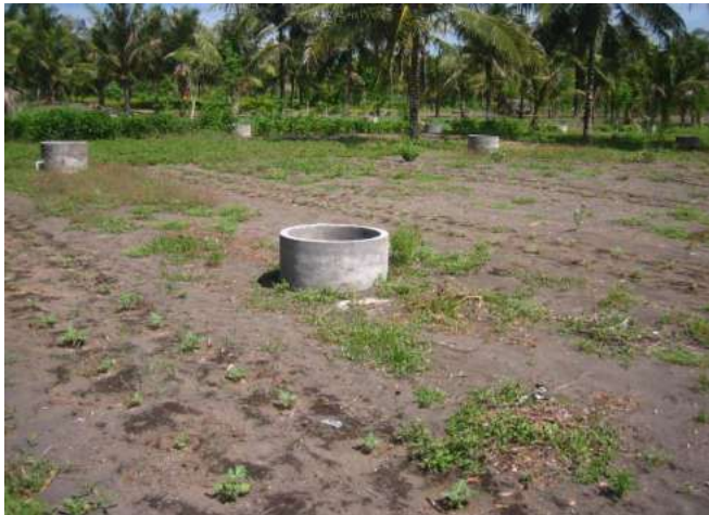
Gambar 4.3. Penggunaan sumur renteng untuk irigasi

Dalam pengelolaan lahan pantai selain harus menggunakan berbagai teknologi untuk memanipulasi lahan, kita juga harus memperhatikan pula kelestarian lingkungan di lahan pantai, hal ini dilakukan terutama terhadap sumber daya air tawar yang sangat penting bagi pertanian lahan pantai. Penggunaan pompa air dan selang air dapat dilihat pada Gambar 4.4. Jangan sampai menggunakan air tanah secara berlebihan karena dapat menyebabkan intrusi air laut ke daratan, untuk itu manajemen untuk mempertahankan kelengasan sangat penting terutama dalam hal untuk mengawetkan keberadaan sumber air tawar di pantai. Selain itu dalam pelaksanaan pertanian lahan pantai harus pula memperhatikan kehidupan sosial para warganya, jangan sampai cara-cara budidaya yang ada bertentangan dengan adat istiadat warga sekitarnya (Putri, 2011).