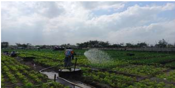
Gambar 4.7 Pengairan Tanaman Kedelai

Penyiraman seperti pada Gambar 4.7. dilakukan dua hari sekali pada pagi atau sore hari dengan cara menyiram tanaman dengan air menggunakan selang yang ujungnya terdapat shower.