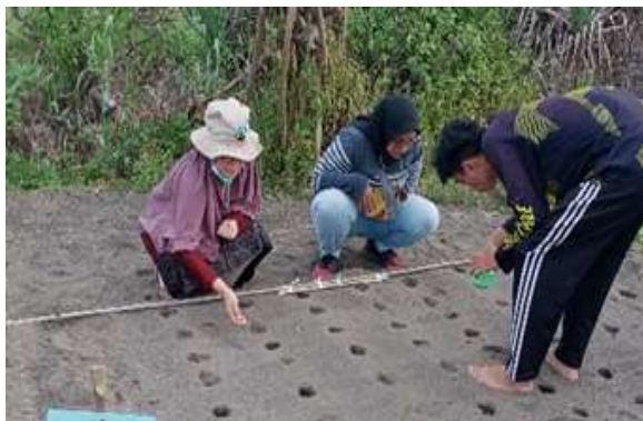
Gambar 4.6. Penanaman Kedelai

Penanaman dilakukan dengan jarak tanam 30 cm x 20 cm setiap lubang tanam ditanam 3 benih. Penanaman kedelai di lahan pasir pantai Samas dapat dilihat pada Gambar 4.6.