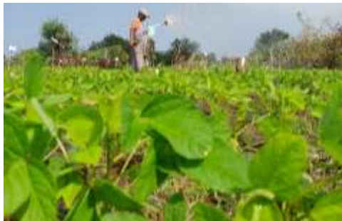
Gambar 2.1 Pertanaman Kedelai

Tanaman kedelai merupakan tanaman semusim yang memiliki masa panen antara 72-90 hari. Tanaman kedelai tumbuh tegak dengan tinggi 40-90 cm, memiliki daun tunggal dan daun bertiga ( trifoliolate ). Percabangan pada tanaman kedelai sangat sedikit dan Sebagian bertrikoma padat baik di daun maupun polong (Adie dan Krisnawati, 2007). Tanaman Kedelai memiliki morfologi yang dibedakan menjadi beberapa bagian yaitu akar, batang, daun, bunga, polong dan biji. Gambar 2.1 menunjukkan pertanaman kedelai.