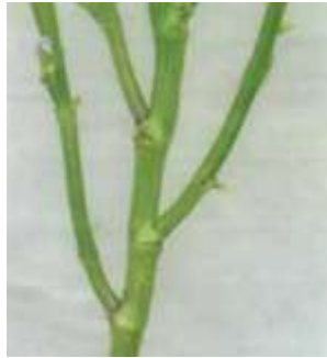
Gambar 2.3 Bentuk Batang Kedelai (Adisarwanto, 2005)

(Rianto, 2016). Bentuk batang kedelai dapat dilihat pada Gambar 2.3.