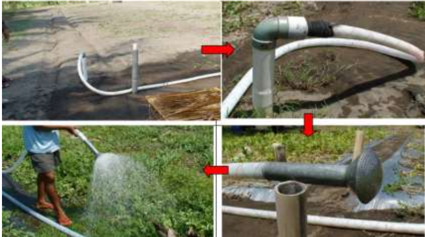
Gambar 4.4. Penggunaan pompa air dan selang untuk pemenuhan air.