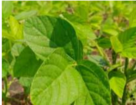
Gambar 2.4. Daun Kedelai