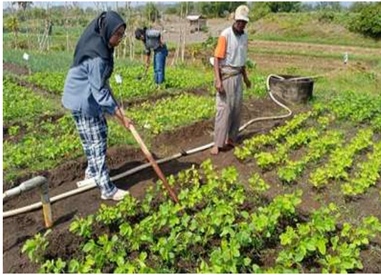
Gambar 4.9. Penyiangan Gulma