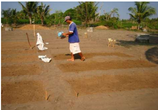
Gambar 4.2. Pemberian lumpur di lahan pasir pantai

Penggunaan bahan halus di lahan pasir pantai dapat memanfaatkan tanah lempung, abu vulkan, endapan saluran sungai, kolam waduk. Penggunaan bahan halus bertujuan untuk meningkatkan jumlah koloid dalam tanah, khususnya penambahan fraksi lempung (Gambar 4.2). Peningkatan jumlah bahan halus dalam tanah akan bermanfaat terhadap peningkatan hara dan air.