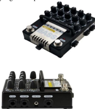
Gambar 4.1 Body kit preamplifier gitar bass elektrik yang ada di pasaran

Berdasarkan hasil evaluasi pemilihan alternatif yang didapat, bahwa alternatif 1 adalah pilihan terbaik menurut konsumen. Maka desain alat terdahulu mengalami beberapa perubahan, antar lain pada tombol kontrol dan tata letak posisi kontrol ukuran alat, bobot alat, serta kemudahan pengoperasian alat preamplifier gitar bass elektrik. Berikut gambar preamplifier yang ada di pasaran.