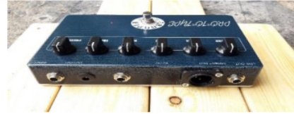
Gambar 4.2 Body kit preamplifier gitar bass elektrik hasil rancangan

Setelah melalui beberapa tahapan perancangan alat dan perubahan komponen, bahwa body kit preamplifier dioperasikan dari susunan knob tidak terlalu banyak tapi cukup dan sangat berguna bagi penggunaannya, ukuran tulisan pada knob mudah di lihat dari jarak pandang satu sampai tiga meter, tampilan lebih menarik dan bahan yang dipakai kuat akan tetapi memiliki bobot yang cukup ringan, dan memiliki karakter suara yang lebih luas serta lebih bagus. Gambar hasil rancangan perangkat preamplifier gitar bass elektrik dengan desain baru dapat dilihat pada Gambar 4.2.