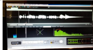
Gambar 4.4 Performansi Alat Rancangan Baru

Selain penilaian secara lisan, beliau juga melakukan pengujian dengan menggunakan software audio . Dapat dilihat dari performansi alat dari software audio dapat dilihat pada Gambar 4.4 dan 4.5.