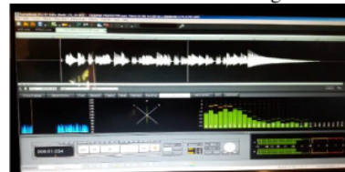
Gambar 4.5 Performansi Alat yang Sudah Ada

Dari gambar yang dilihat diatas dapat dilihat bahwa performansi suara yang dihasilkan dari produk dengan rancangan baru jauh lebih kuat dan stabil daripada dengan performansi alat yang sebelumnya.