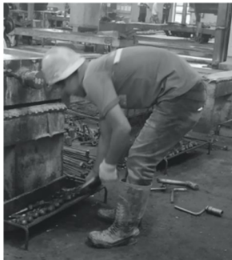
Gambar 2. Postur kerja Pekerja 2