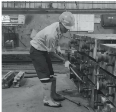
Gambar 1. Postur kerja Pekerja 1