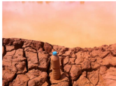
Gambar 3. Pengambilan Sampel dengan Botol

Pengambilan sampel sebanyak 11 titik tersebut diambil pada pipa masukan (inlet) dan keluaran (outlet) lumpur dari tiap Segmen. Adapun mediapengambilan sampel berbentuk tabung (botol) dengan volume 600 ml, seperti yang ditunjukkan pada Gambar 3 .