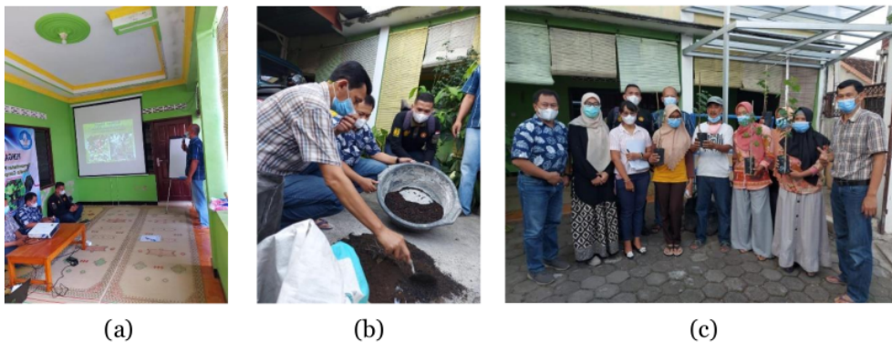
Gambar 3. Kegiatan pengabdian (a) sosialisasi (b) penyuluhan (c) pembagian bibit

pengetahuan tentang budidaya anggur, sehingga produk pupuk organik dari rumah kompos yang telah dimiliki oleh Desa Mayungan akan efektif dalam budidaya tanaman anggur pada lahan sempit. Seluruh kegiatan berhasil dilaksanakan terbukti dari 14 perwakilan masyarakat yang diundang, seluruhnya hadir dalam setiap kegiatan.