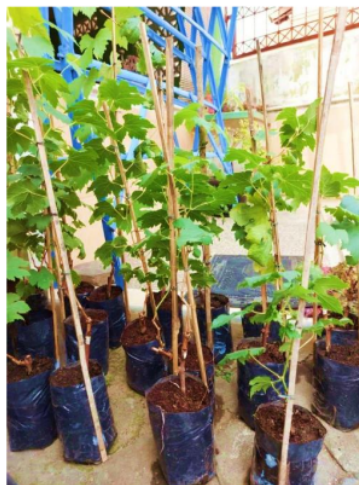
Gambar 5. Bibit Anggur yang Dibagikan kepada Masyarakat Dusun Mayungan

Kemudian dilakukan pembagian bibit anggur bagi masyarakat Desa Mayungan, kegiatan ini dimaksudkan supaya masyarakat dapat mempraktikkan penanaman anggur dengan media tanam campuran biochar di pekarangan rumah masing-masing. Untuk menjaga kualitas, kuantitas praktek, dan keberlanjutannya dilakukan pendampingan serta bimbingan teknis (bimtek) secara berkala. Kegiatan ini bertujuan supaya masyarakat dapat mandiri dalam pengelolaan limbah rumah tangga, mengelola sanitasi lingkungan, dan penanaman anggur.