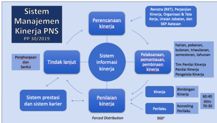
Gambar 1: sistem manajemen kinerja PNS (Peraturan Pemerintah No. 30 Tahun 2019)

Berdasarkan sistem manajemen kinerja PNS tersebut, ditemukan beberapa hal pokok yang perlu diperhatikan, yaitu: pertama , penyusunan perencanaan kinerja pegawai atau Sasaran Kinerja Pegawai (SKP) didasarkan pada perencanaan strategis instansi, perjanjian kinerja, organisasi dan tata kerja, uraian jabatan, dan SKP atasan. Kedua , pentingnya peran atasan sebagai mentor bagi bawahannya. Jika diperlukan mesti disiapkan juga coach atau counsellor untuk mendampingi pegawai yang mengalami kesulitan dalam pencapaian kinerja. Ketiga , Penilaian perilaku pegawai dilakukan dengan pengamatan 360 derajat, artinya bukan hanya atasan yang memberikan penilaian seperti pada DP3 dan juga PP 46, tapi rekan kerja setara, bawahan, dan bahkan penilaian mereka yang mendapatkan jasa juga diikutkan dalam penilaian perilaku.