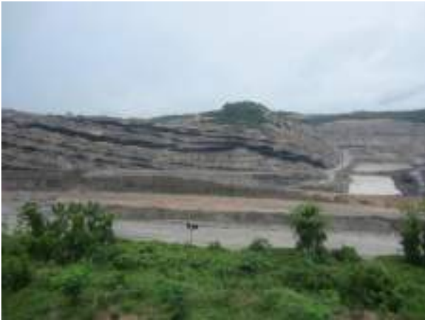
Gambar 3. Lokasi Penelitian Desa Idamangala yang merupakan lokasi Tambang Terbuka Batubara