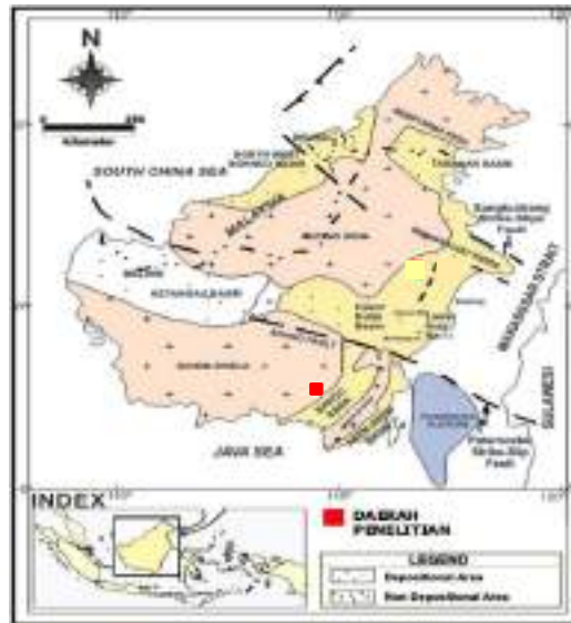
Gambar 2. Lokasi Daerah Penelitian terhadap Elemen-Elemen Tektonik Regional (Ott, 1987)