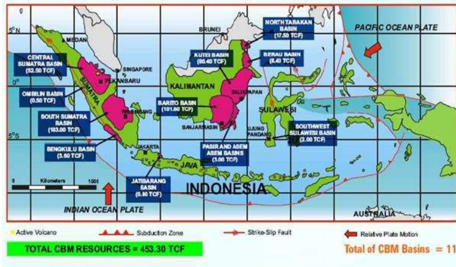
Gambar 1. Lokasi Potensi Cekungan Batubara dan Gas Metana Batubara Indonesia

Salah satu lokasi keterdapatan batubara adalah di Desa Idamanggala, Kec. Sungai Raya, Kab.Hulu Sungai Selatan, Kalimantan Selatan termasuk dalam Cekungan Barito (Awang et al. , 1994). Formasi pembawa batubara di Daerah Idamanggala adalah Formasi Warukin yang berumur Miosen Tengah- Akhir (Supriatna et al. , 1994) (Gambar 2). Ketebalan lapisan batubara Idamanggala dibandingkan dengan lapisan batubara lainnya di Indonesia adalah sangat tebal yaitu berkisar 2 meter – 40meter.