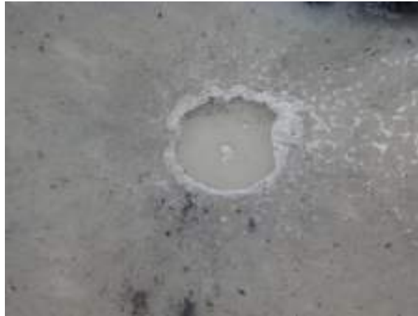
Gambar 5. Manifestasi rembesan Gas metana Batubara Seam M-10