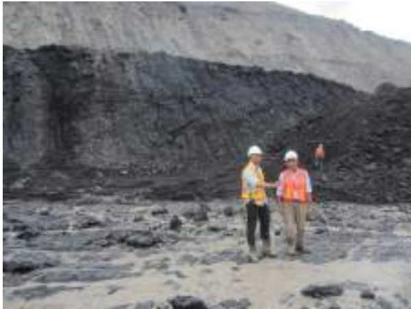
Gambar 4. Singkapan Batubara Seam M-10 di dinding Tambang Batubara