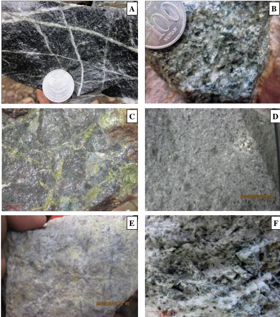
Gambar 2. (A) Foto ubahan biotit-klorit-magnetit±K-felspar (potasik) teramati di Sungai Kinomaligan. (B) Foto ubahan klorit-magnetit-aktinolit±epidot teramati di cabang kiri Sungai Tayap. (C) Foto ubahan klorit-epidot±magnetit teramati di cabang Sungai Kinomaligan. (D) Foto ubahan klorit-kalsit±epidot yang teramati di daerah Minanga Uuwan. (E) Foto ubahan silika-mineral lempung ±klorit ±magnetit yang teramati di punggungan antara Sungai Tayap dan Sungai Kinomaligan. (F) Foto alterasi argilik teramati di bagian bawah Sungai Tayap.

metode fire assay untuk Au dan ICP untuk multi unsur.