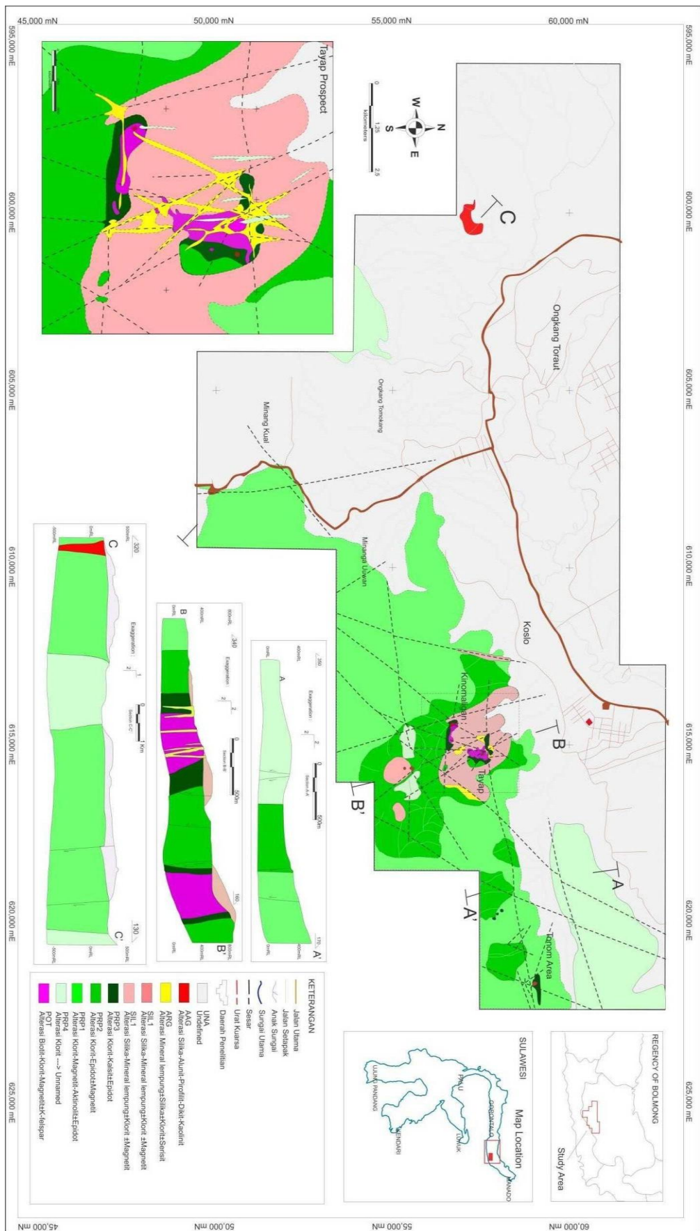
Gambar 3. Peta alterasi daerah penelitian.