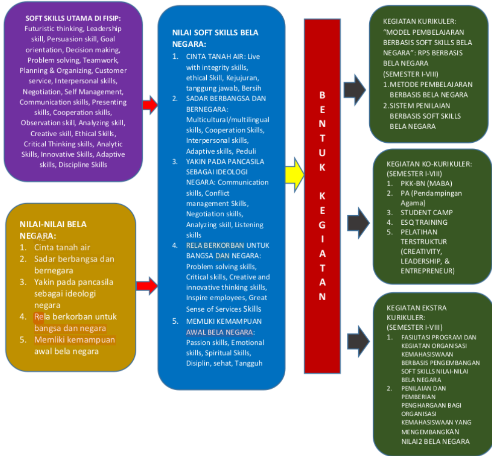
Gambar 1. Bentuk Kegiatan Internalisasi Soft Skills Bela Negara

dilakukan setiap saat dengan menggunakan sistem kurikulum yang telah ditentukan program studi. Oleh karenanya, proses internalisasi melalui jalur kurikuler ini, merupakan sarana yang efektif dalam membentuk sikap dan karakter bela negara.