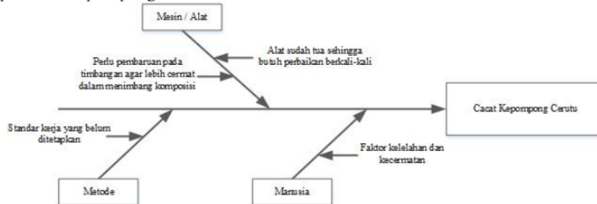
Gambar 3.2 Diagram Fishbone

Diagram fishbone dapat mengidentifikasi faktor-faktor penyebab cacat pada proses produksi kepompong