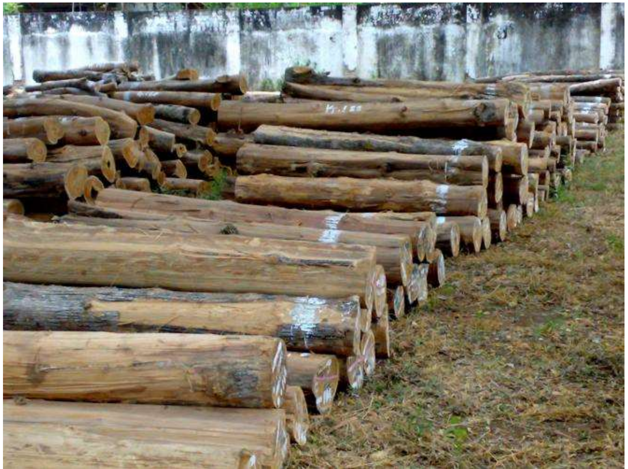
Gambar Kayu Gelondongan

hutan/lahan penghasil kayu sebagai dampak pertumbuhan masyarakat dan bisnis perumahan yang meluas.