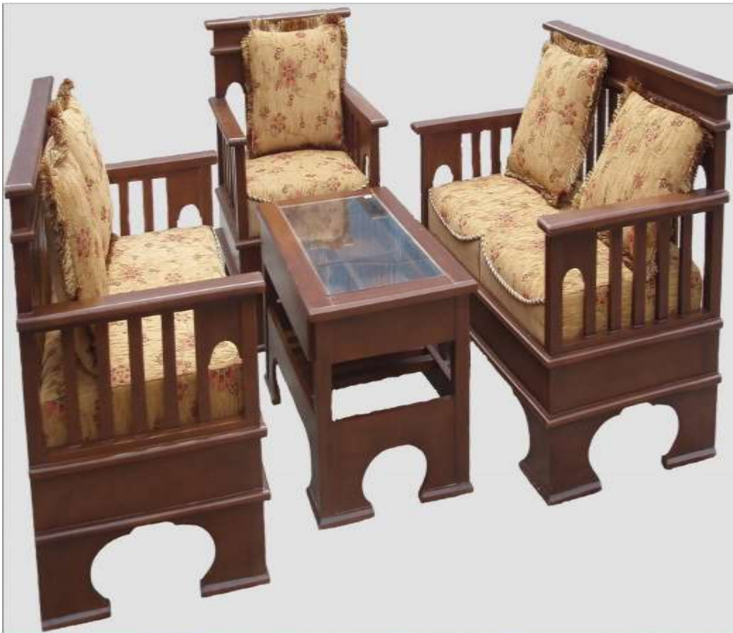
Gambar Kursi Tamu : ndikhome.com

penduduk khususnya seperti yang ada di Indonesia saat ini, maka secara otomatis memiliki dampak pada peningkatan ketertarikan dan permintaan masyarakat pada Furniture ini.