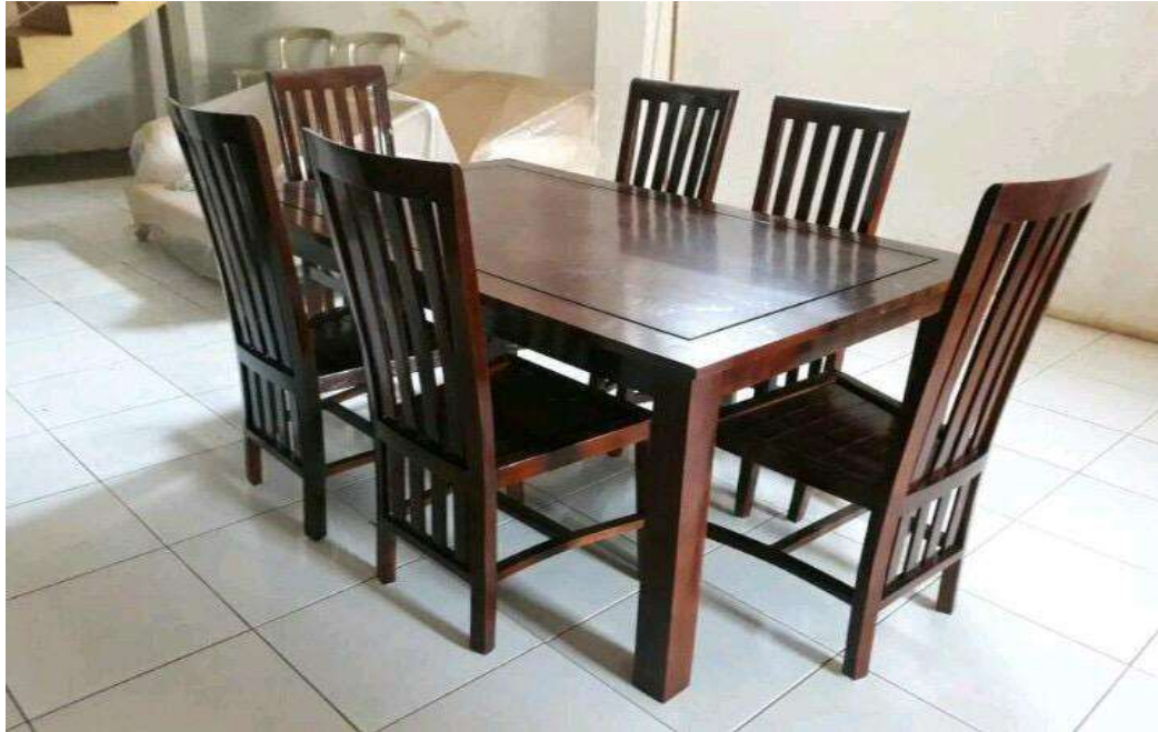
Gambar Meja makan

Membuka usaha baru apalagi di desa memang gampang-gampang susah. Sebenarnya tidak hanya di desa sih, di kota pun, kita harus pandai-pandai membaca situasi. Namun, ada satu bisnis yang terbukti bisa survive dimanapun usaha itu berada, namanya bisnis mebel atau furniture.