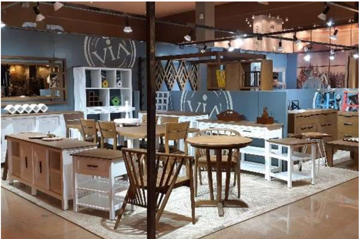
Gambar Pameran Mebel Kayu IFEX 2019

Furniture anda. Dengan modal brosur dan kartu nama, anda dapat mengenalkan usaha Furniture anda pada khalayak yang lebih luas lagi. Ditambah lagi jika ada beberapa pameran, anda dapat menyewa suatu area untuk dapat mengikuti pameran tersebut.