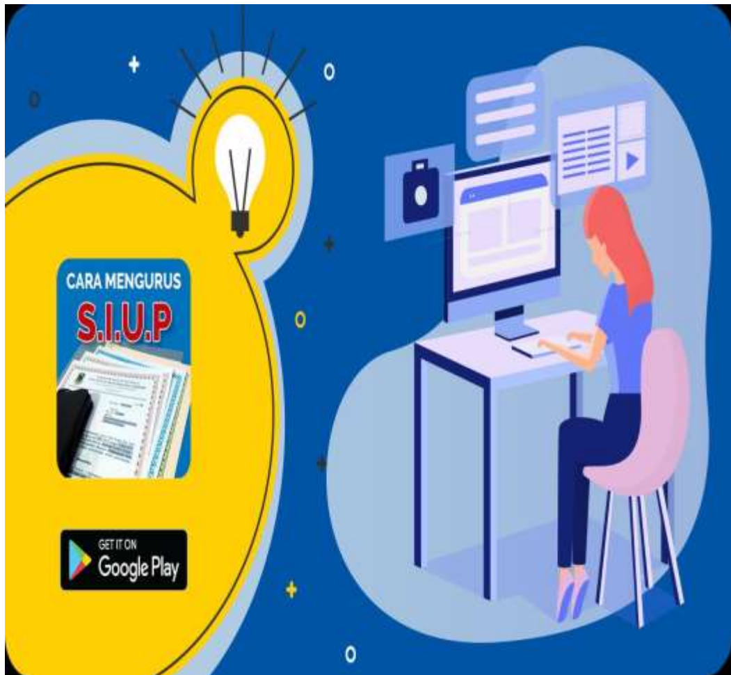
Gambar Cara Mengurus SIUP

NPWP dan SIUP. Segeralah urus, daripada anda terkena denda di kemudian hari.