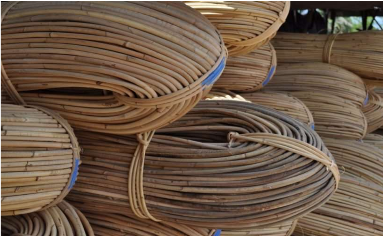
Gambar Rotan

Bahan satu ini sedang naik daun di pasaran internasional. Indonesia pun kaya akan bahan ini. Namun, anda perlu melakukan pelatihan khusus karena tidak semua orang bisa mengolah rotan.