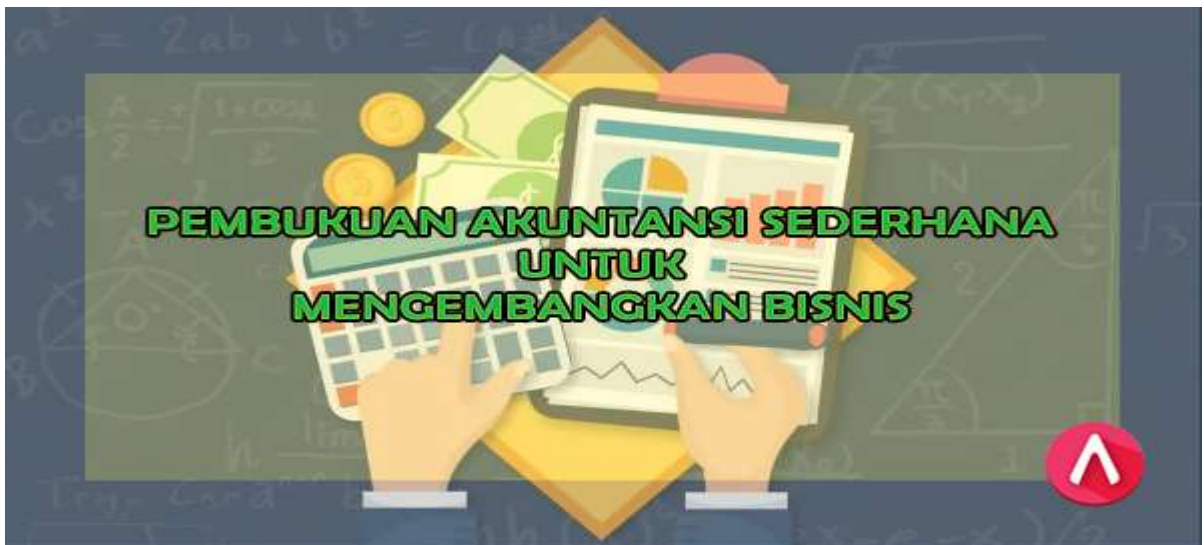
Gambar Pembukuan

Untuk memulai usaha ini, yang harus anda ketahui adalah rincian untuk modal apa saja yang perlu anda beli untuk membuat usaha dengan harapan biaya pengeluaran untuk perbulannya.