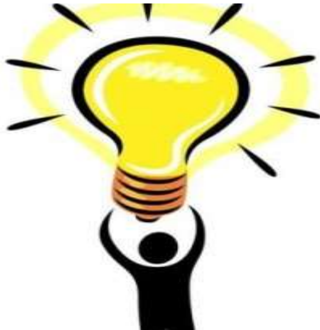
Gambar Ide : kompasiana.com