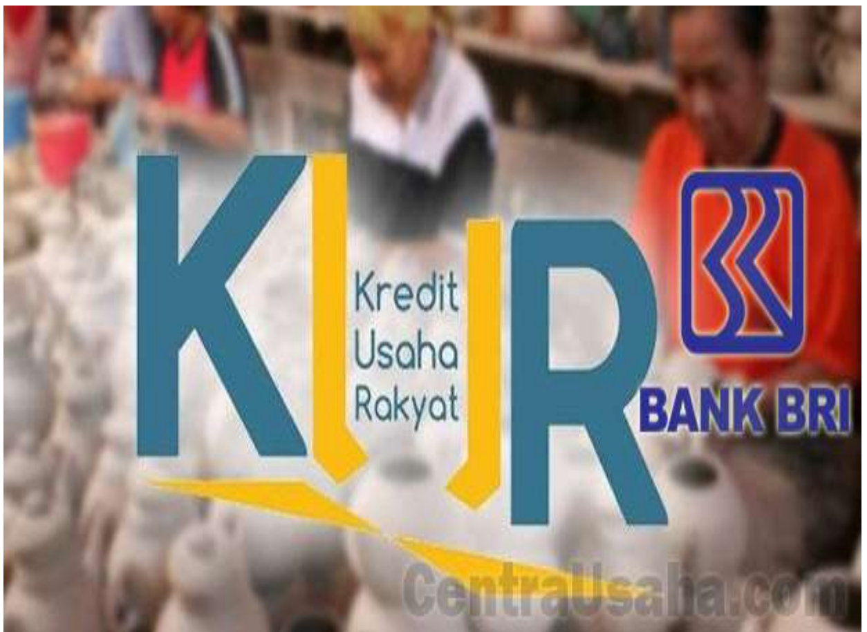
Gambar KUR

memberi anda pengalaman, networking, dan tentu saja uang kas. Jika sudah yakin dengan kemampuanmu, anda bisa mengajukan modal ke Bank. Cobalah KUR BRI atau Mitra Mandiri yang mematok bunga rendah.