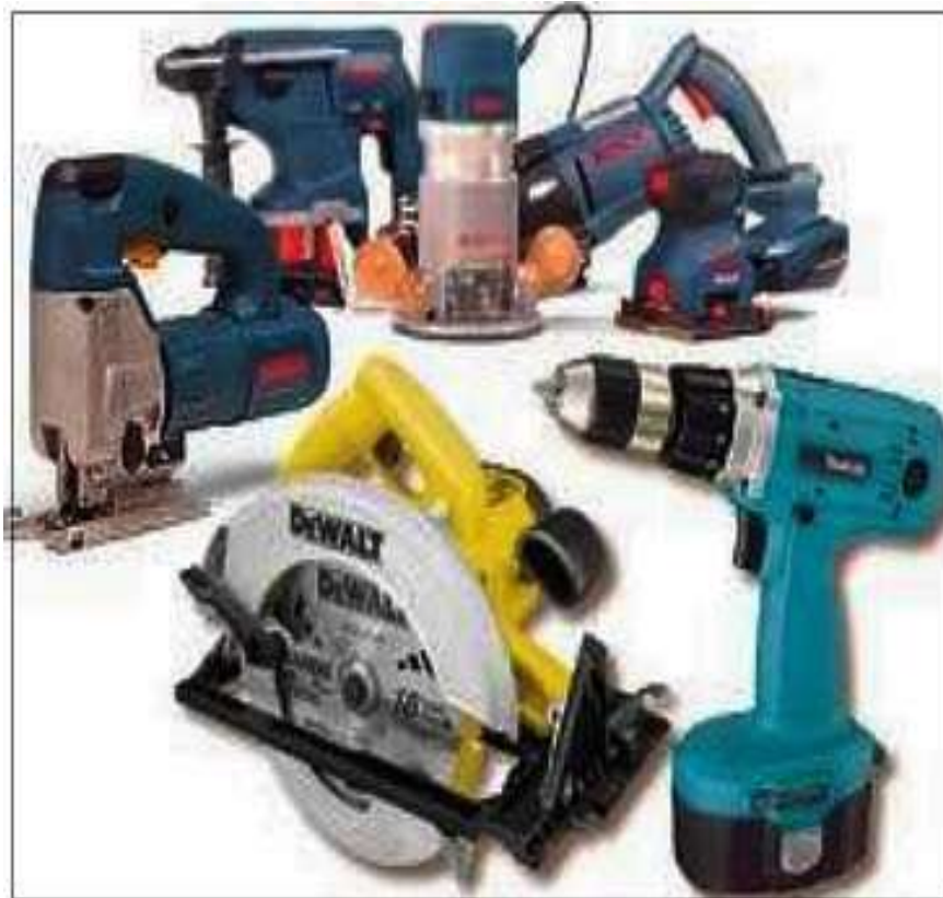
Gambar Alat Pertukangan Kayu