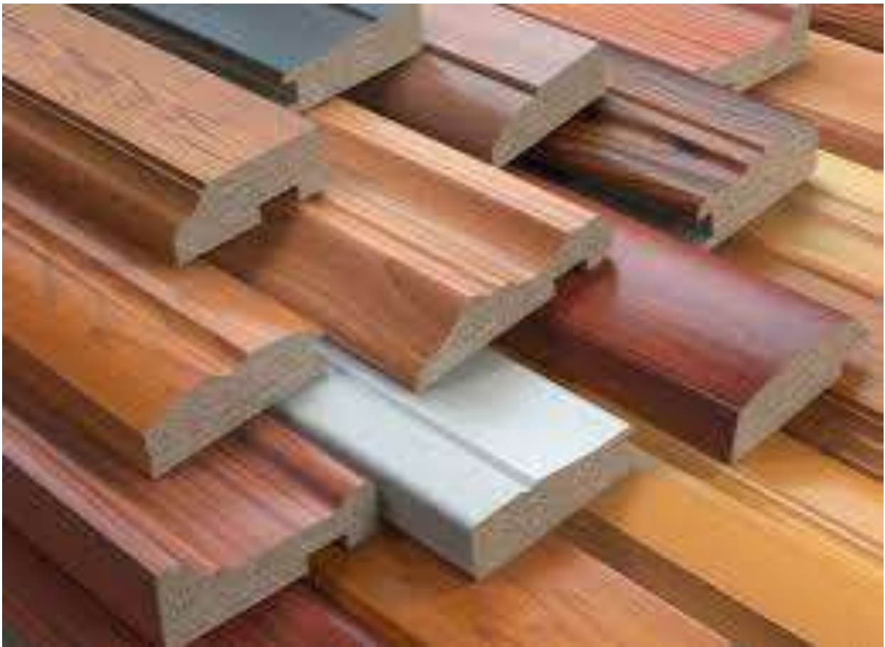
Gambar Medium Density Fibreboard

kayu tipis dan halus. Ini adalah pilihan bagus dan murah untuk produksi masal.