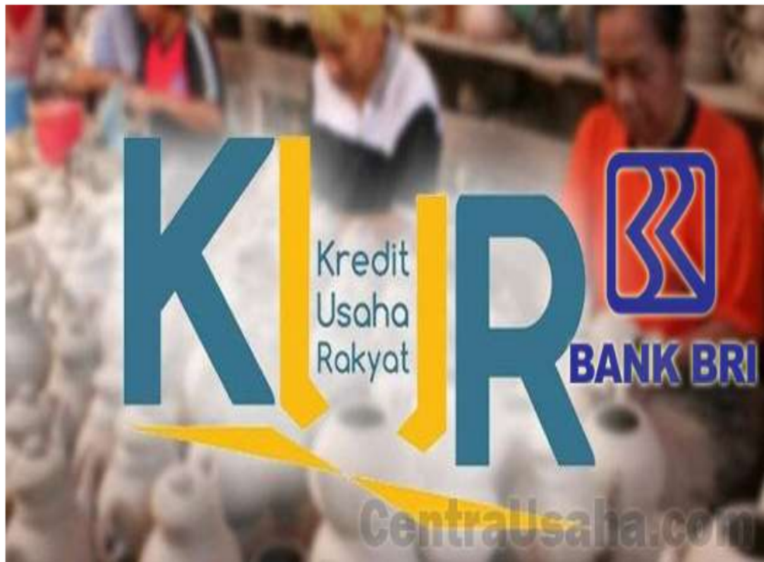
Gambar KUR : centrausaha.com

memberi anda pengalaman, networking, dan tentu saja uang kas. Jika sudah yakin dengan kemampuanmu, anda bisa mengajukan modal ke Bank. Cobalah KUR BRI atau Mitra Mandiri yang mematok bunga rendah.