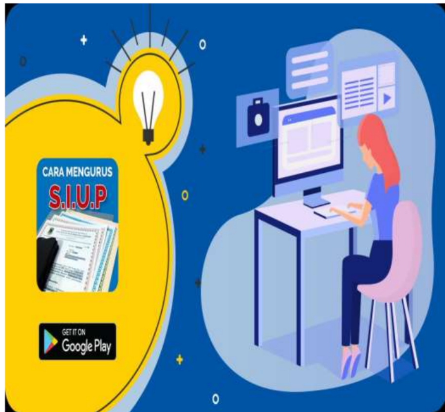
Gambar Cara Mengurus SIUP : apkpure.com

NPWP dan SIUP. Segeralah urus, daripada anda terkena denda di kemudian hari.