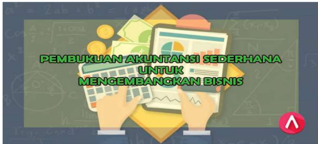
Gambar Pembukuan

6 Untuk memulai usaha ini, yang harus anda ketahui adalah rincian untuk modal apa saja yang perlu anda beli untuk membuat usaha dengan harapan biaya pengeluaran untuk perbulannya.