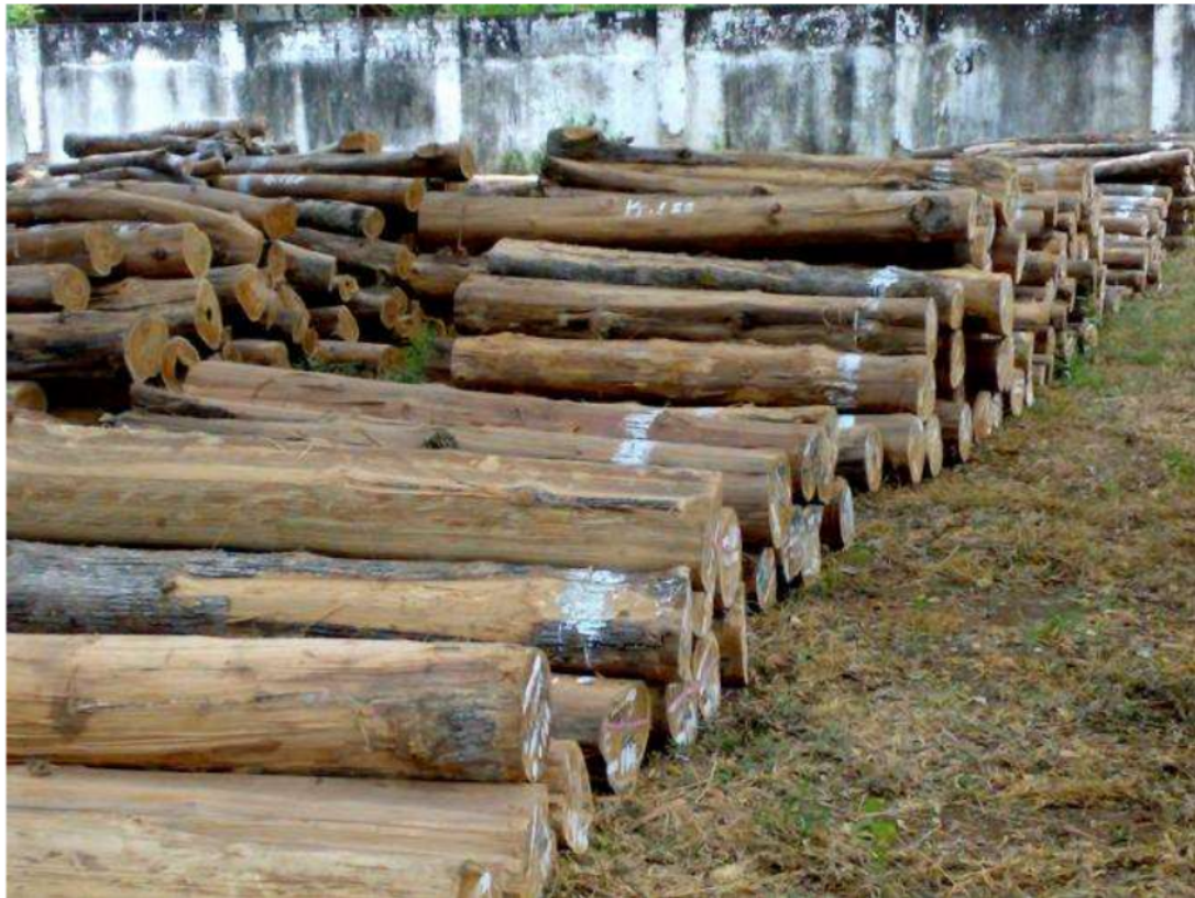
Gambar Kayu Gelondongan : jasafurniturewordpress.com

hutan/lahan penghasil kayu sebagai dampak pertumbuhan masyarakat dan bisnis perumahan yang meluas.