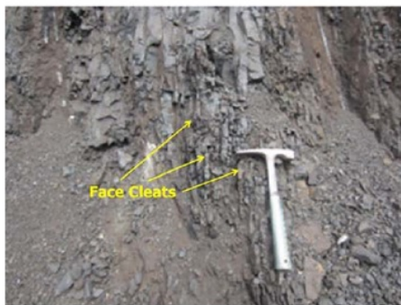
Gambar 2. Kenampakan macro cleat (face cleats) kekar batubara Seam M-10 Formasi Warukin