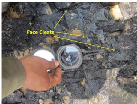
Gambar 3. Pengukuran Cleat pada Seam M-10 Formasi Warukin

Metode yang digunakan adalah survey lapangan, pengambilan data lapangan, penyortiran data, penghitungan data, analisis secara statistik, dan analisis laboratorium. Pada pengambilan data lapangan, data cleat diambil dalam medium singkapan 100cm x 100cm ( windows sampling ). Data berupa spasi cleat , bukaan cleat , arah cleat , dan conto batuan untuk analisis. Analisis yang dilakukan adalah Analisis inti batuan, yang pada analisa ini akan didapatkan nilai densitas cleat , porositas cleat , dan permeabilitas cleat (Gambar 3).