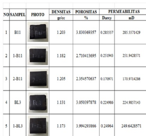
Tabel 1. Hasil analisis laboratorium porositas dan permeabilitas Seam M-10 Formasi Warukin

Formasi Warukin bagian bawah hingga Formasi Warukin bagian atas memiliki nilai rata-rata untuk porositas cleat yaitu 2,354 – 3,994 % dan Permeabilitas cleat pada Formasi Warukin bagian bawah hingga Formasi Warukin bagian atas memiliki nilai rata-rata adalah 170, 971 – 285,557 mD.