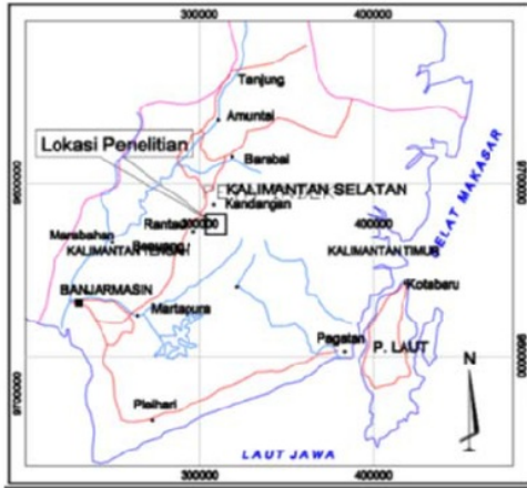
Gambar 1. Lokasi daerah penelitian, Kalimantan Selatan