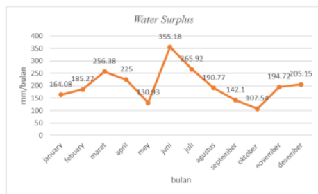
Gambar 1: Gambar 4.2 Water Surplus Lubang Bekas Tambang

dari hasil perhitungan medel neraca air menghitung debit air bulanan dengan menggunakan data curah hujan, evapotranspirasi, tampungan air tanah, dan data klimatologi. nilai water surplus tertinggi pada bulan juni sebesar 355.18 mm/bulan, water surplus terendah di daerah penelitian pada bulan mey 130.93 mm/bulan. dapat dilihat pad grafik berikut (gambar 1)