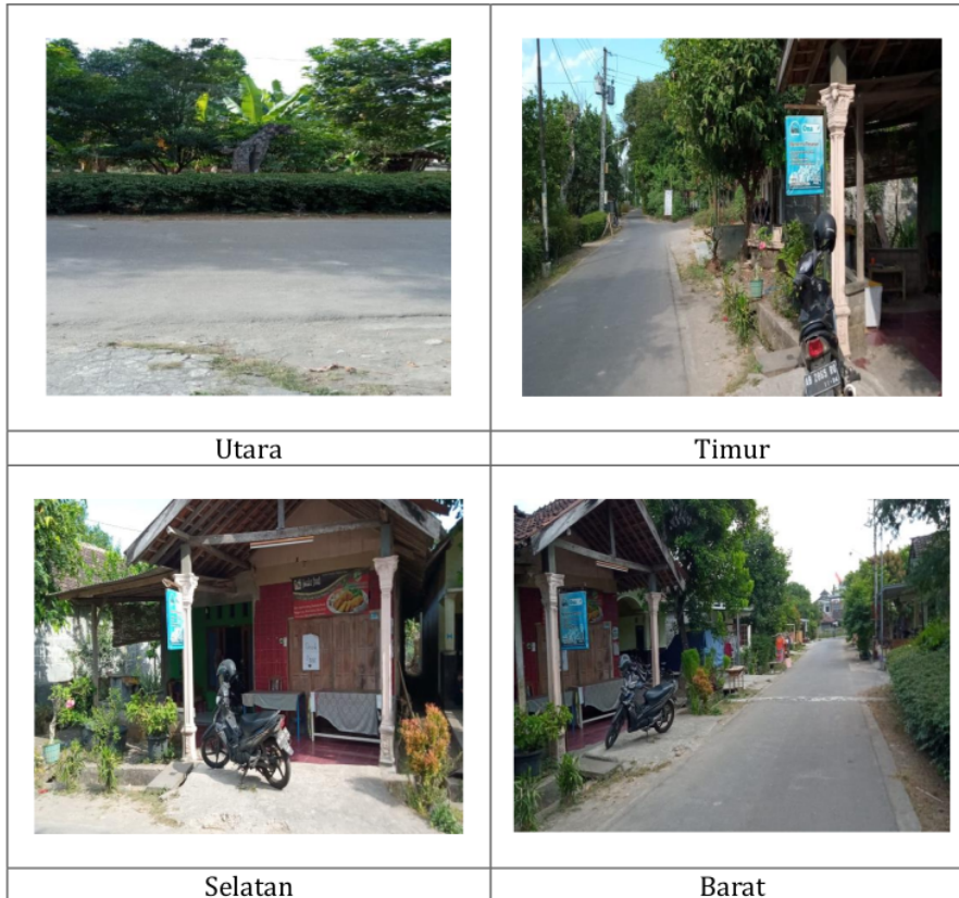
Gambar 2. Kondisi lingkungan di sekitar lokasi Pengabdian bagi Masyarakat di Dusun Sribit

Kondisi jalan di sekitar lokasi Pengabdian bagi Masyarakat yang ada di lingkungan Dusun Sribit sudah cukup baik karena jalan sudah diperkeras dengan aspal dan merupakan jalan lingkungan. Kondisi lingkungan tersebut dapat dilihat pada Gambar 2 berikut.