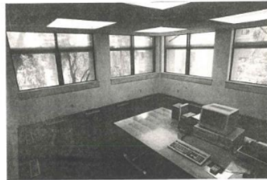
Gambar 9. Suatu ruang dengan jendela yang terbuat dari kaca dan tidak dilengkapi dengan ventilasi udara

Berdasarkan penelitian tersebut didapatkan hasil bahwa suhu ruang pada gambar 8 lebih rendah daripada suhu ruang pada gambar 9. Suhu ruang yang lebih rendah tersebut akan berpengaruh pada suasana kerja yang dirasakan oleh para pekerja. Suasana yang lebih nyaman akan membuat para karyawan menjadi lebih cocok dan bersemangat dalam bekerja sehingga produktivitasnya akan meningkat.