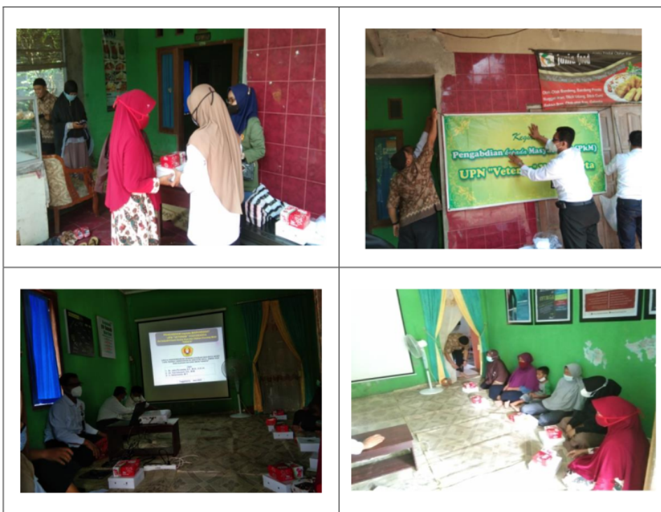
Gambar 6. Suasana kegiatan penyuluhan, pelatihan, dan pendampingan Tim PbM di Industri aneka kue dan olahan kacang mete “Onafa”