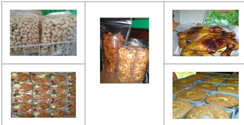
Gambar 4. Produk industri kecil “Onafa”

Pada perkembangan selanjutnya terjadinya wabah Covid-19. Pemerintah membuat peraturan agar selama masa pandemi, masyarakat hanya tinggal di rumah saja dan mengurangi kegiatan di luar rumah. Hal ini berdampak besar pada omzet penjualan Onafa. Pesanan menurun drastis, banyak kegiatan yang