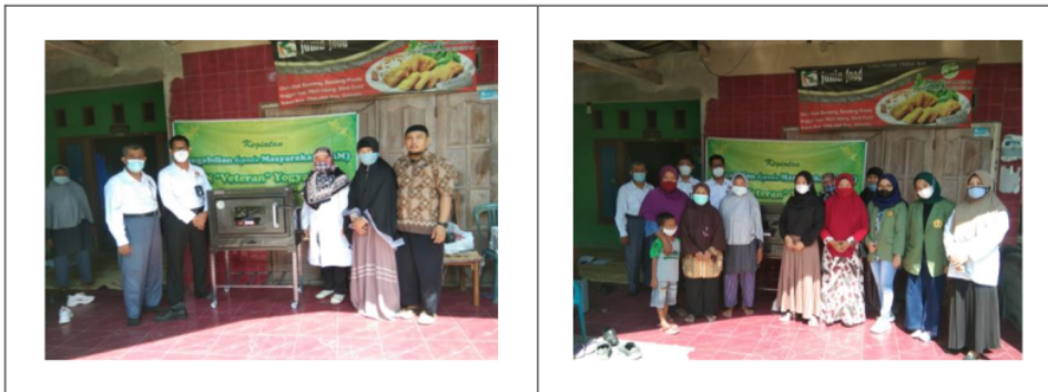
Gambar 5. Pemberian bantuan alat produksi ke “Onafa” dan foto Bersama tim PbM, pimpinan dan karyawan “Onafa” serta para mahasiswa