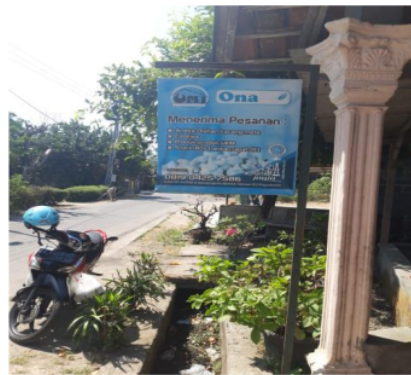
Gambar 1. Lokasi industri kecil aneka kue dan olahan mete “Onafa”

Lokasi Pengabdian bagi Masyarakat yaitu di industri kecil aneka kue dan olahan kacang mete “Onafa” yang berlokasi di Dusun Sribit RT 006 RW 013, Kalurahan Sendangtirto, Kapanewon Berbah, Kabupaten Sleman, DIY.