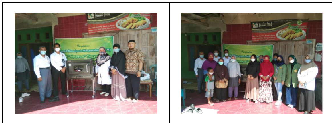
Gambar 5. Pemberian bantuan alat produksi ke “Onafa” dan foto Bersama tim PbM, pimpinan dan karyawana “Onafa” serta para mahasiswa