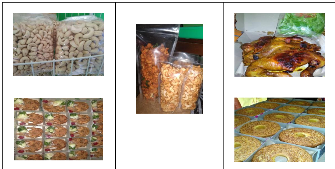
Gambar 4. Produk industri kecil “Onafa”

Pada perkembangan selanjutnya terjadinya wabah Covid-19. Pemerintah membuat peraturan agar selama masa pandemi, masyarakat hanya tinggal di rumah saja dan mengurangi kegiatan di luar rumah. Hal ini berdampak besar pada omzet penjualan Onafa. Pesanan menurun drastis, banyak kegiatan yang