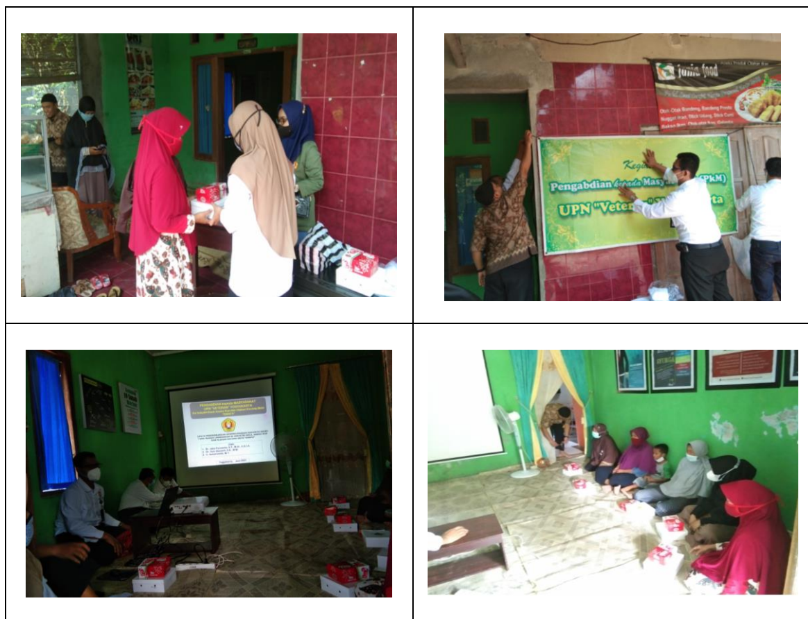
Gambar 6. Suasana kegiatan penyuluhan, pelatihan, dan pendampingan Tim PbM di Industri aneka kue dan olahan kacang mete “Onafa”