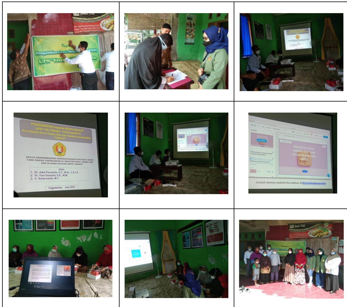
Gambar 7. Dokumentasi pelaksanaan Pengabdian bagi Masyarakat

Dokumentasi terkait pelaksanaan PbM tersebut adalah sebagai berikut: