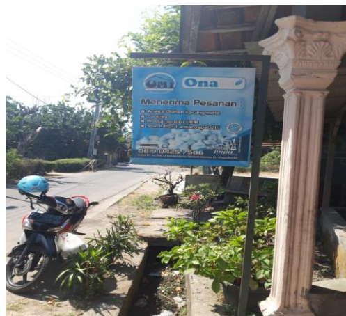
Gambar 1. Lokasi industri kecil aneka kue dan olahan mete “Onafa”

Lokasi Pengabdian bagi Masyarakat yaitu di industri kecil aneka kue dan olahan kacang mete “Onafa” yang berlokasi di Dusun Sribit RT 006 RW 013, Kalurahan Sendangtirto, Kapanewon Berbah, Kabupaten Sleman, DIY.