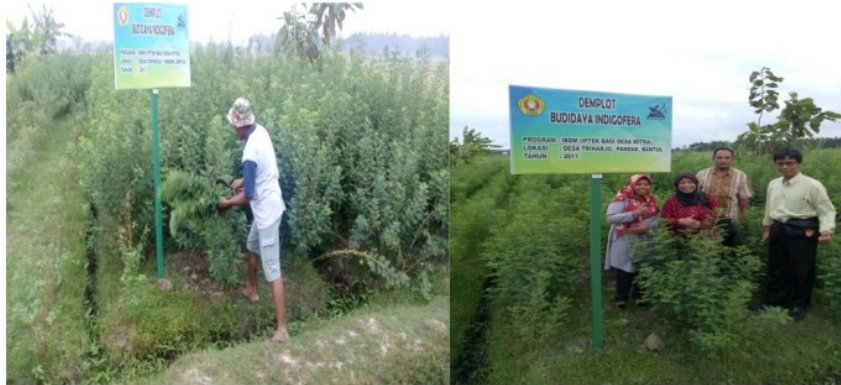
Gambar 1. Perkebunan tanaman Indigofera sp

relatif mahal yaitu Rp 75.000,- Satu kilo pasta indigo bisa digunakan untuk mewarnai kain sebanyak 4 potong dengan ukuran 1,1 x 2,0 m.