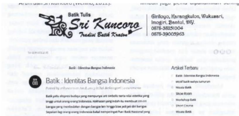
Gambar 2. Tampilan website mitra dampingan

Edukasi dan praktik pengolahar limbah skala kecil perlu dilakukan karezn dalam rangka perbaikan kualitas prose: produksi yang dijadikan sebagai syara untuk memperoleh sertifikasi kualita produk. Prinsipnya Pembuatan bak atai sumur resapan pengolahan Iimbah cai untuk skala kecil perlu dipisahkan antar. limbah batik alam dan sintetis. Teknik dai waktu pengontrolan •bak penampun, limbah juga perlu dipahamikan sehingga