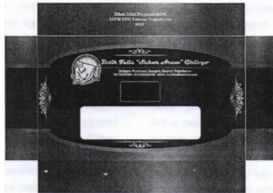
Gambar 1. Kemasan Batik Tulis yang Marketable

waktu ke waktu meningkat dan dari berbagai daerah atau negara. Gambar 2 merupakan tampilan website luaran pendampingan IbPE. Alamat website mitra dampingan adalah alamat http://batiksekararum.com dan http://batiksriuncoro.com . Adapun pertimbangan tim abdimas membuat Website berbayar ini bertujuan untuk meningkatkan citra positif batik Sekar Arum dan Sri Kuncoro (Wenno, 2012).