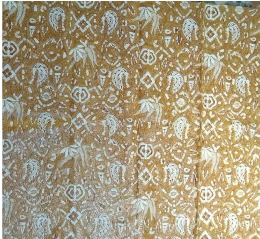
Proses Pembuatan Batik Tulis