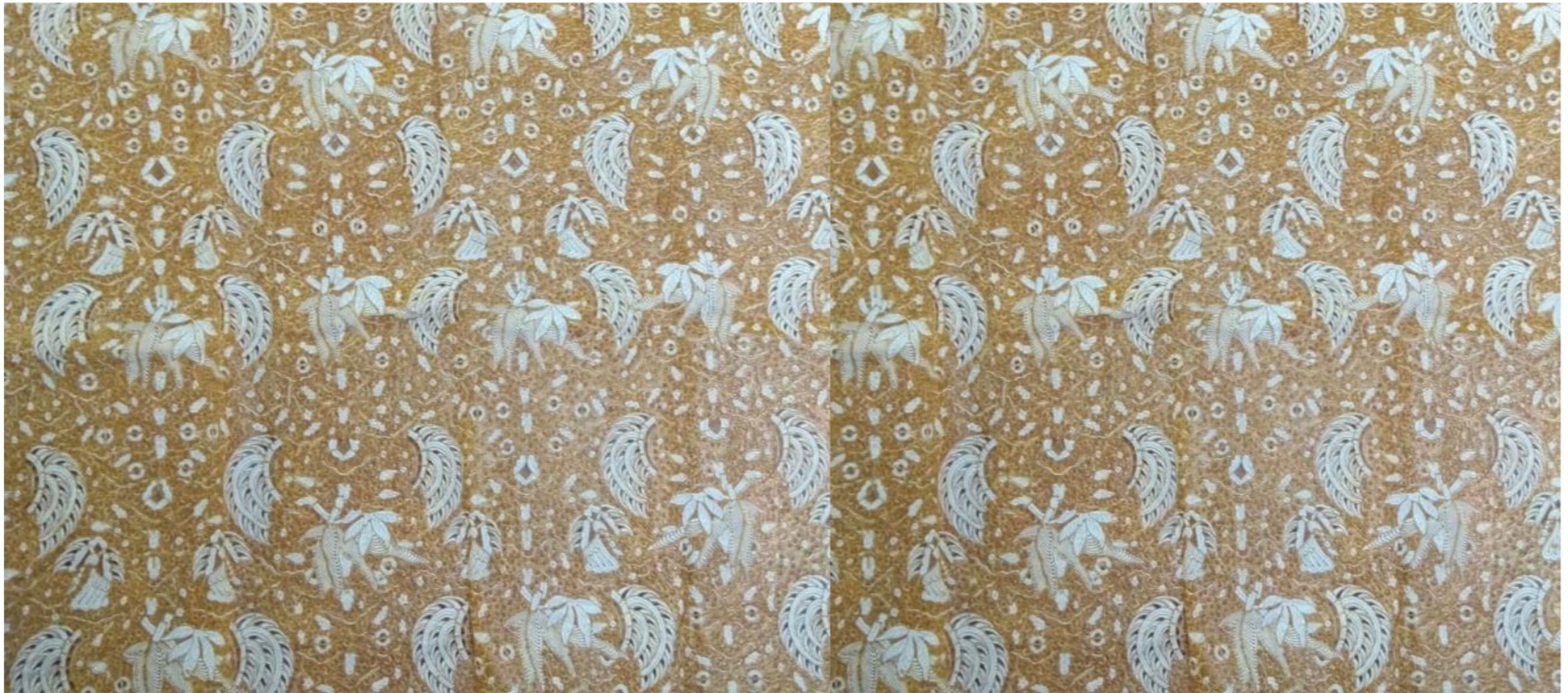
Proses Pembuatan Batik Tulis