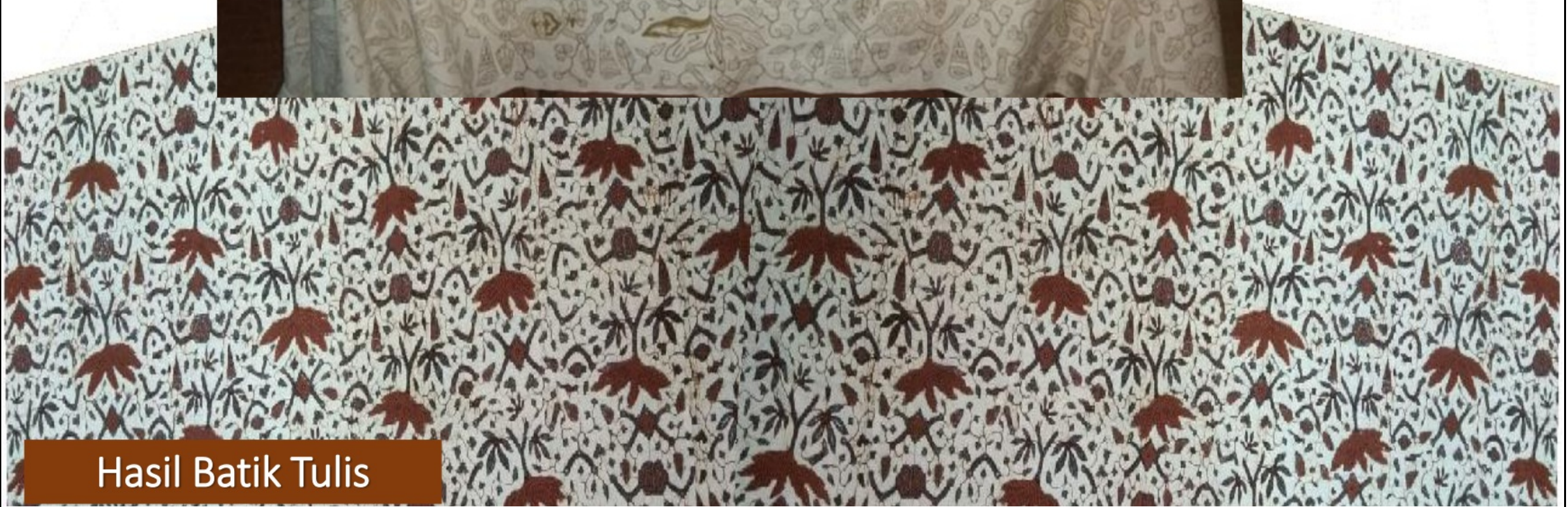
Hasil Batik Tulis