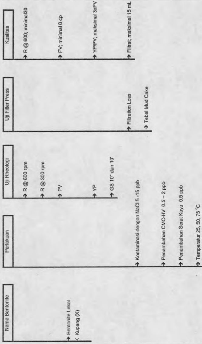
Gambar 5. Prosedur Penelitian Lumpur Dasar Bentonite Lokal X + NaCl + CMC-HV + Serat Kayu