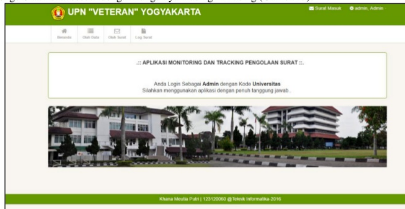
Gambar 3. Implementasi Antarmuka Halaman Utama Admin

Antarmuka ini merupakan tampilan dari halaman utama kontrol panel aplikasi yang akan muncul setelah admin login ke dalam aplikasi. Di halaman ini tersedia menu yang apabila di klik maka akan mengarah menuju pengelolaan data sesuai dengan fungsinya masing – masing (Gambar 3).