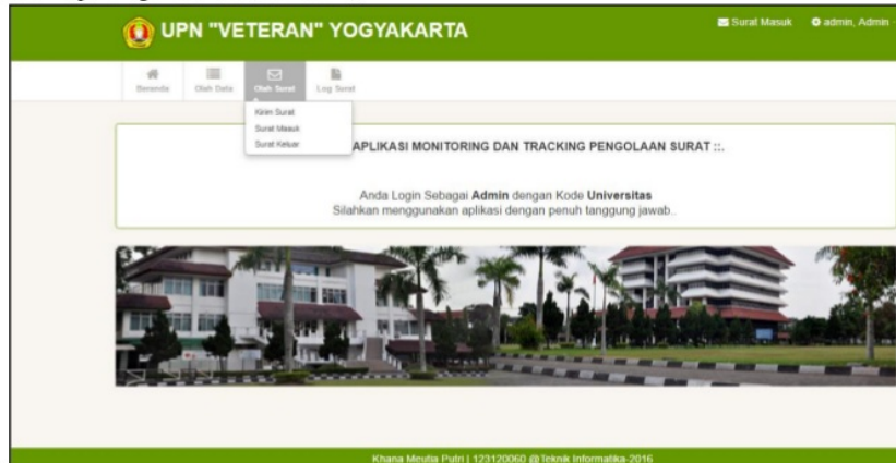
Gambar 4. Implementasi Antarmuka Menu Olah Data Surat Admin Universitas

Perancangan ini merupakan tampilan dari halaman menu olah data surat admin universitas. Menu olah data surat terdiri dari kirim surat, olah data surat masuk, oleh data surat keluar. Menu-menu ini berfungsi untuk mengolah data surat sesuai kepentingan admin (Gambar 4).