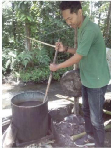
Gambar 2. Alat Pelorot Malam yang Selama Ini Digunakan Industri

Alat pelorot malam yang selama ini digunakan oleh industri batik ditampilkan pada Gambar 2. Perancangan alat pelorot malam dibuat berdasarkan kriteria yang diinginkan industri batik. Kriteria yang diinginkan yaitu meningkatkan produktivitas, merancang alat yang efektif, alat mudah dioperasikan, mengurangi kelelahan pekerja dan resiko cedera. Hasil yang didapatkan dalam perancangan dan penjelasan tugas dijadikan konsep untuk perancangan alat. Hasil perancangan alat pelorot malam pada penelitian ini ditampilkan pada Gambar 3.