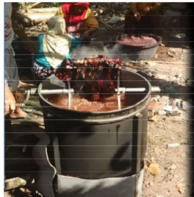
Gambar 3. Alat Pelorot Malam Hasil Perancangan