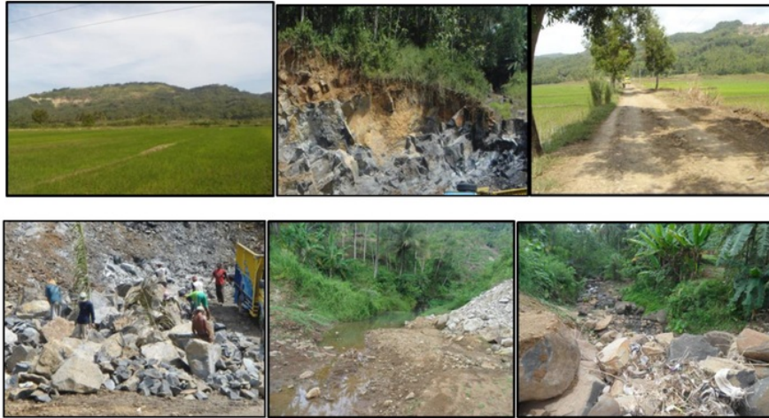
Gambar 2 Daya dukung dan daya tampung potensi sumberdaya basalt