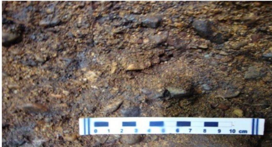
Foto 1. Merupakan salah satu penampakan satuan batuan konglomerat-krakal, diatas merupakan kenampakan litologi konglomerat sampai krakal yang mempunyai fragmen mangan. Kamera menghadap ke barat daya. (Satuan batuan konglomerat-krakal)

Kode : KOA 1 Batuan : Konglomerat - Krakal