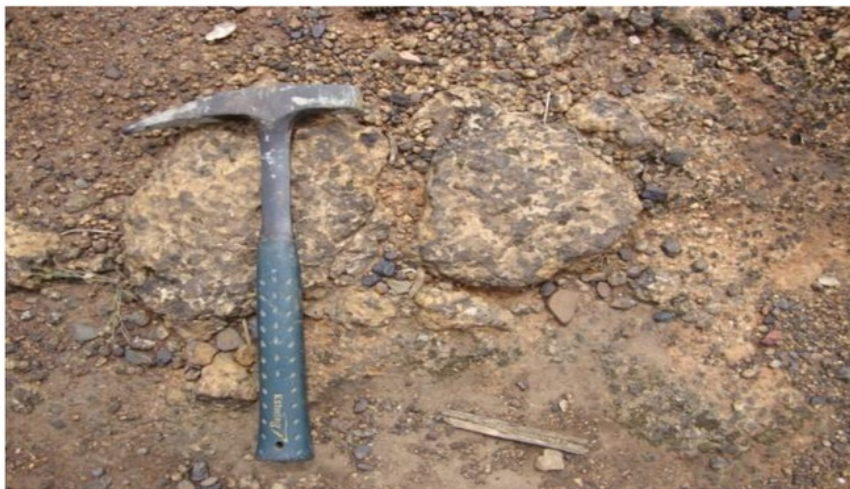
Foto 2. Merupakan salah satu penampakan satuan batuan konglomerat-krakal, diatas merupakan kenampakan litologi lanau yang mempunyai nodul-nodul mangan. Kamera menghadap ke utara. (Satuan batuan

Kode : KOA 2 Batuan : Batulanau (Nodul Mangan)