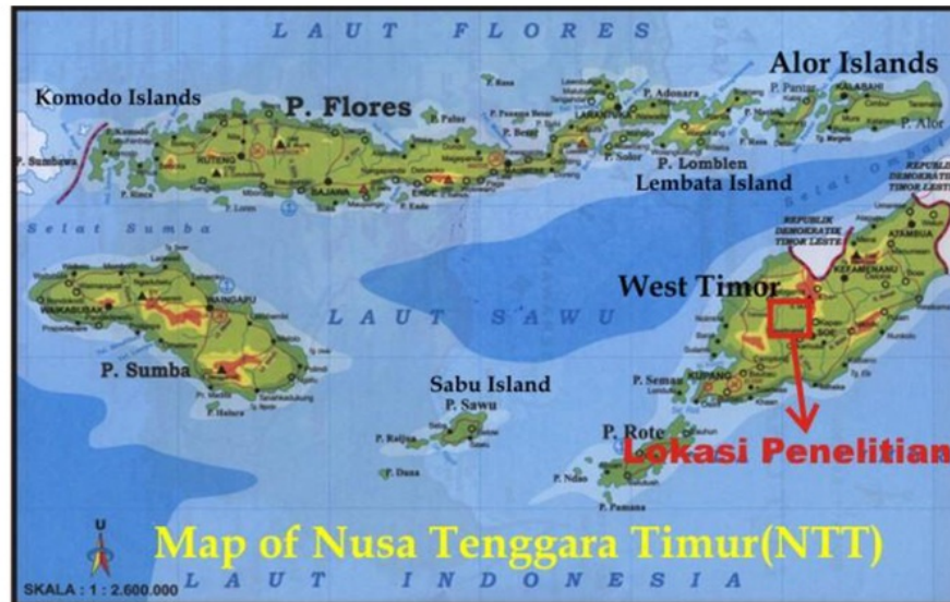
Gambar 1. Lokasi Daerah Penelitian