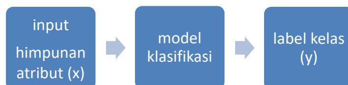
Gambar 2.1 Klasifikasi sebagai pemetaan input himpunan atribut x ke dalam kelas label y (Khomsah, 2016)

Klasifikasi adalah proses pembelajaran fungsi target f yang memetakan setiap sekumpulan himpunan atribut x ke dalam kelas label y yang belum diketahui sebelumnya seperti yang diilustrasikan Gambar 3.2.