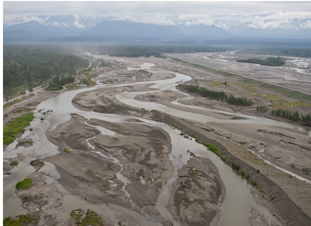
Gambar 1. Pembuangan limbah tailing dari proses pengolahan bijih tembaga pada aliran sungai dapat menyebabkan kerusakan lingkungan

Aspek kerusakan lingkungan yang dinilai pada penelitian ini adalah: pendangkalan sungai, penurunan kualitas air permukaan, berkurangnya biota sungai dan fauna. Akibat kegiatan pembuangan tailing ke badan sungai yang mengalir dari dataran tinggi ke dataran rendah menyebabkan sungai menjadi dangkal. Penurunan mutu lingkungan berupa kerusakan ekosistem yang menyebabkan terancamnya rantai kehidupan makhluk hidup di sepanjang aliran sungai.