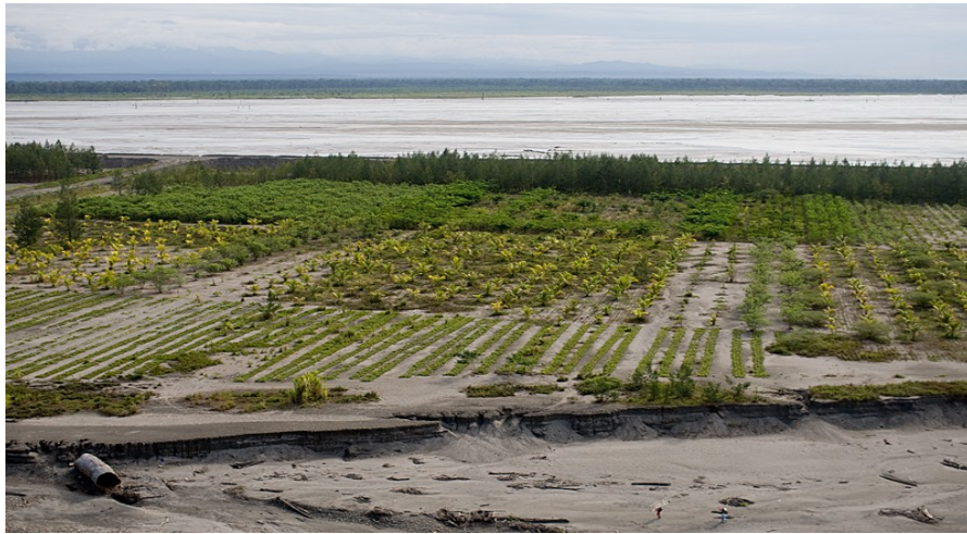
Gambar 3. Indikator keberhasilan model reklamasi ditandai tumbuhnya tanaman tingkat rendah dan tinggi

Jenis vegetasi yang tumbuh ditentukan oleh ukuran butiran tailing yang mengendap, status unsur hara, dan kelembaban tanah tailing di lokasi tersebut. Perubahan pemulihan habitat ditandai penutupan lahan oleh vegetasi yang signifikan. Selain itu indikator keberhasilan pekerjaan reklamasi adalah ditemukannya burung, kupu-kupu, dan satwa lain seperti famili aves, mamalia, dan reptil dalam tanaman tingkat rendah seperti rumput-rumputan, paku-pakuan, semak dan tanaman tingkat tinggi (hutan).