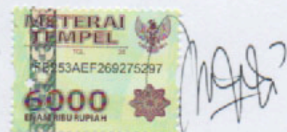
Anggi Dwi Nugrahesti